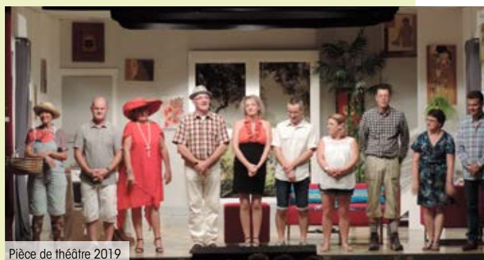
Pièce de théâtre 2019