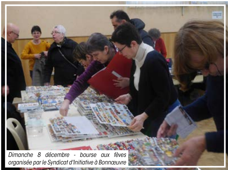
Dimanche 8 décembre - bourse aux fêtes organisée par le Syndicat d'Initiative à Bonnœuvre