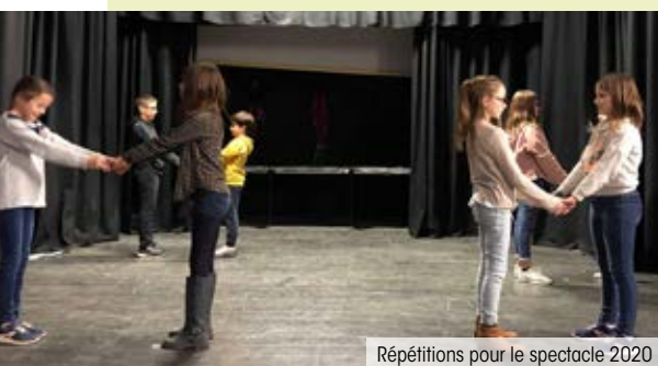
Répétitions pour le spectacle 2020