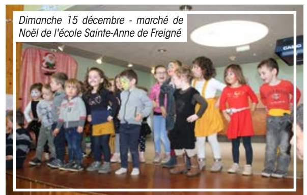
Dimanche 15 décembre - marché de Noël de l'école Sainte-Anne de Freigné