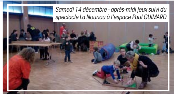
Samedi 14 décembre - après-midi jeux suivi du spectacle La Nounou à l'espace Paul GUIMARD