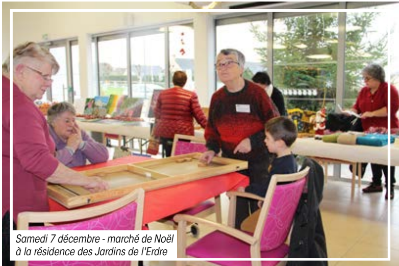
Samedi 7 décembre - marché de Noël à la résidence des Jardins de l'Erdre

Vous participerez aux évènements à venir de la commune ? N'hésitez pas à partager vos photos ( servicecommunication@vallonsdelerdre.fr )