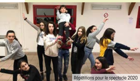
Répétitions pour le spectacle 2020