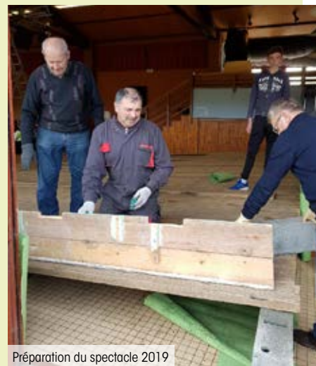
Préparation du spectacle 2019

À partir de fin février, le rythme s'accélère avec les répétitions générales et la transformation de l'espace des Ardoisières en salle de spectacle. Il y a 3 répétitions générales pour lesquelles tous les membres de la troupe doivent être présents. Ces répétitions permettent d'ajuster la mise en scène des sketches et de travailler les transitions. Après la 1 re répétition générale, 2 personnes de l'équipe technique préparent toutes les musiques de changement de scène, adaptées à chaque scène. La dernière répétition générale aura lieu le 13 mars prochain pour les dernières retouches et tout sera fin prêt pour vous accueillir les 14, 15, 20 et 21 mars 2020.