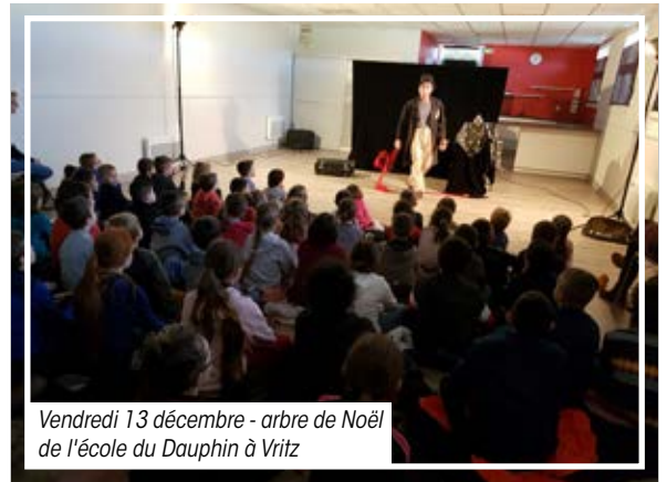
Vendredi 13 décembre - arbre de Noël de l'école du Dauphin à Vritz