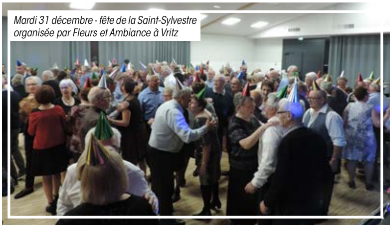
Mardi 31 décembre - fête de la Saint-Sylvestre organisée par Fleurs et Ambiance à Vritz