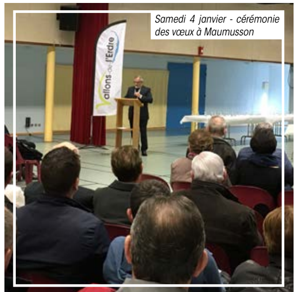
Samedi 4 janvier - cérémonie des vœux à Maumusson